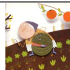
La cachette Que pensent les personnages ?