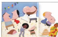
La fête de mariage Que pense la grand-mère ?