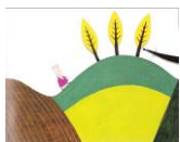
La rencontre avec le loup Que pensent les personnages ?

= pour travailler les états mentaux des personnages