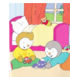
Les enfants jouent ensemble.