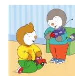
Les enfants se réconcilient.