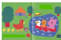
p 10-11 La demande d'aide

= pour travailler les états mentaux des personnages