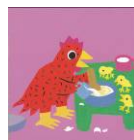
p 28 La poule fait du pain.